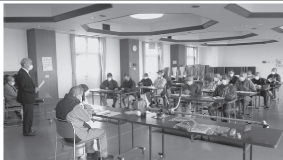
鉄南ふれあい センター

初めて参加された会員は経験豊かな先輩会員から扱い方の丁寧な手ほどきを受け、熱心に聞き入っていました。2回目の講習は8月頃を予定しております。興味のある方は是非参加して下さい。