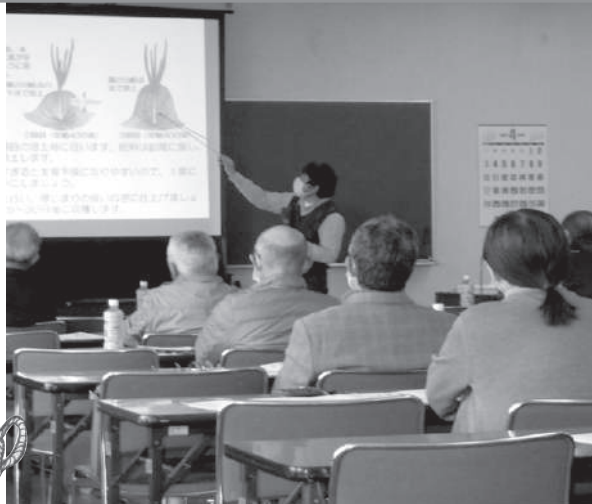
市民会館での講習会