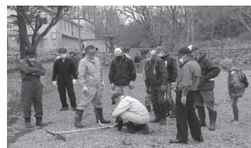
旧二ナルカ 会館周辺