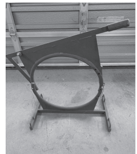
第1号「袋詰め台」 第2号「イタドリ結束器」