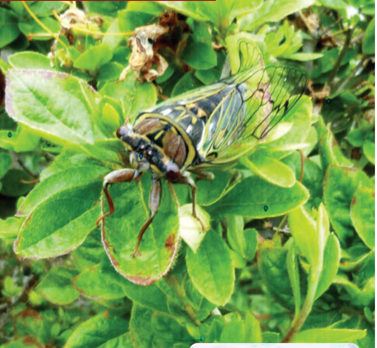
我家の庭に訪れてくれたセミ君“ミン・ミ〜ン”

◎表紙カバースペースは会員の皆さんに開放しています。季節の情景など、ジャンルは問いません。自慢のショットに簡単なコメントを添えて編集部までお寄せ下さい。掲載分には薄謝進呈いたします。