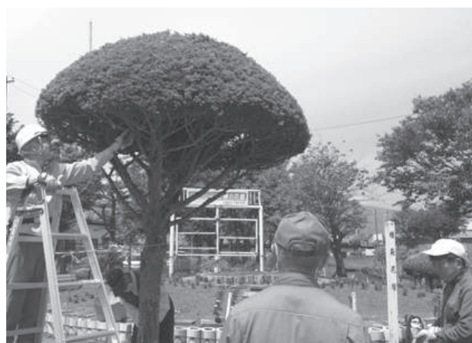
西公園の剪定講習会