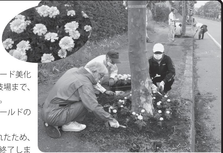
歩道の美化に勢を出すシルバー会員

今年も事務局が事前に草刈りをしてくれたため、参加者の負担や時間の短縮が計られ無事終了しました。会員の皆さん、お疲れ様でした。