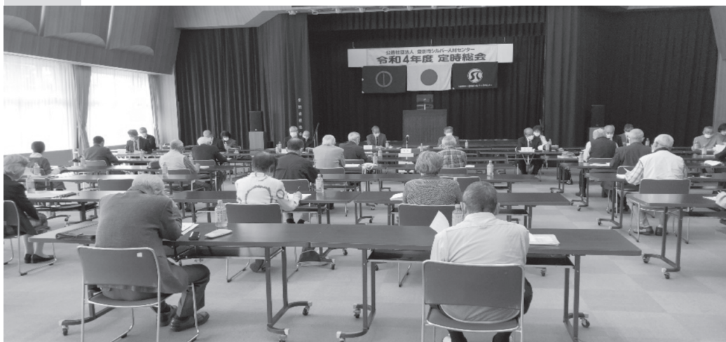
定時総会会場の市民会館中ホール