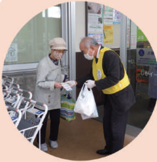
コープさっぽろしが イースト店前での啓発活動

シルバー人材センターPRのため、11月1日(火)10時30分から1時間にわたって市内6カ所の大型店舗前での啓発活動を行いました。