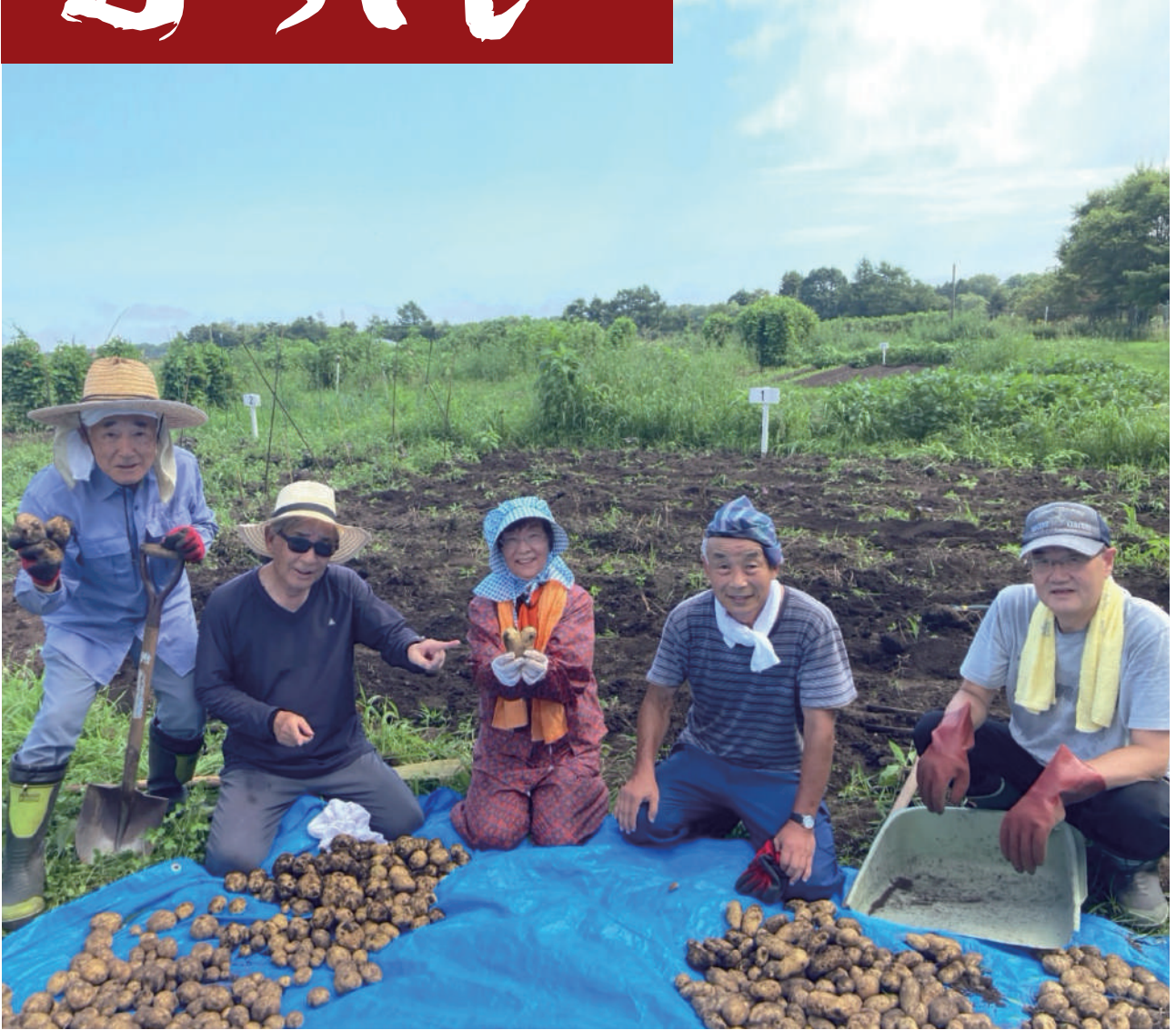
シルバー農園 いも掘り (8月24日)

(令和5年10月31日発行) 公益社団法人登別市シルバー人材センター 発行責任者 松橋 學 編集委員会/〒059-0003登別市千歳町4丁目5-90TEL0143-88-0880(代) https://www.noboribetsusjc.or.jp