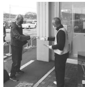
コープさっぽろ 桜木店